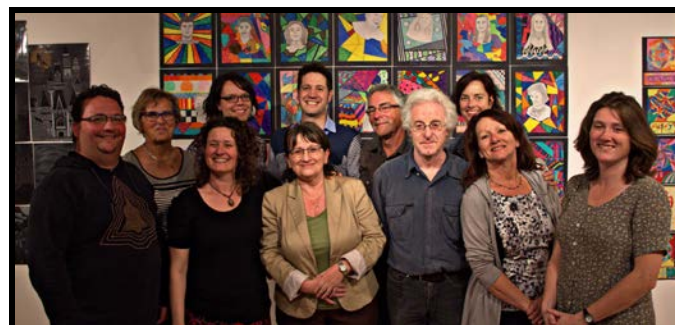
Membres du conseil d'administration et de l'équipe de Centre d'exposition